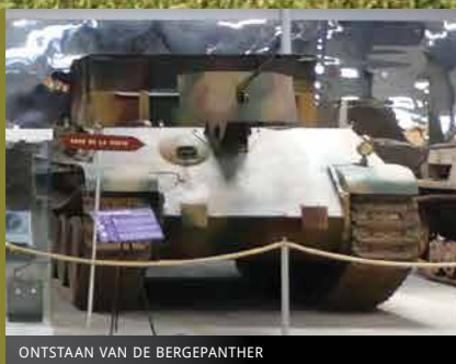
ONTSTAAN VAN DE BERGEPANTHER