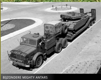
BIJZONDERE MIGHTY ANTARS