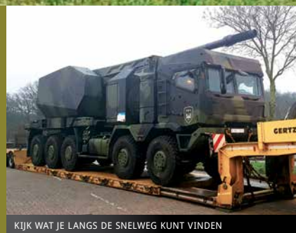
KIJK WAT JE LANGS DE SNELWEG KUNT VINDEN