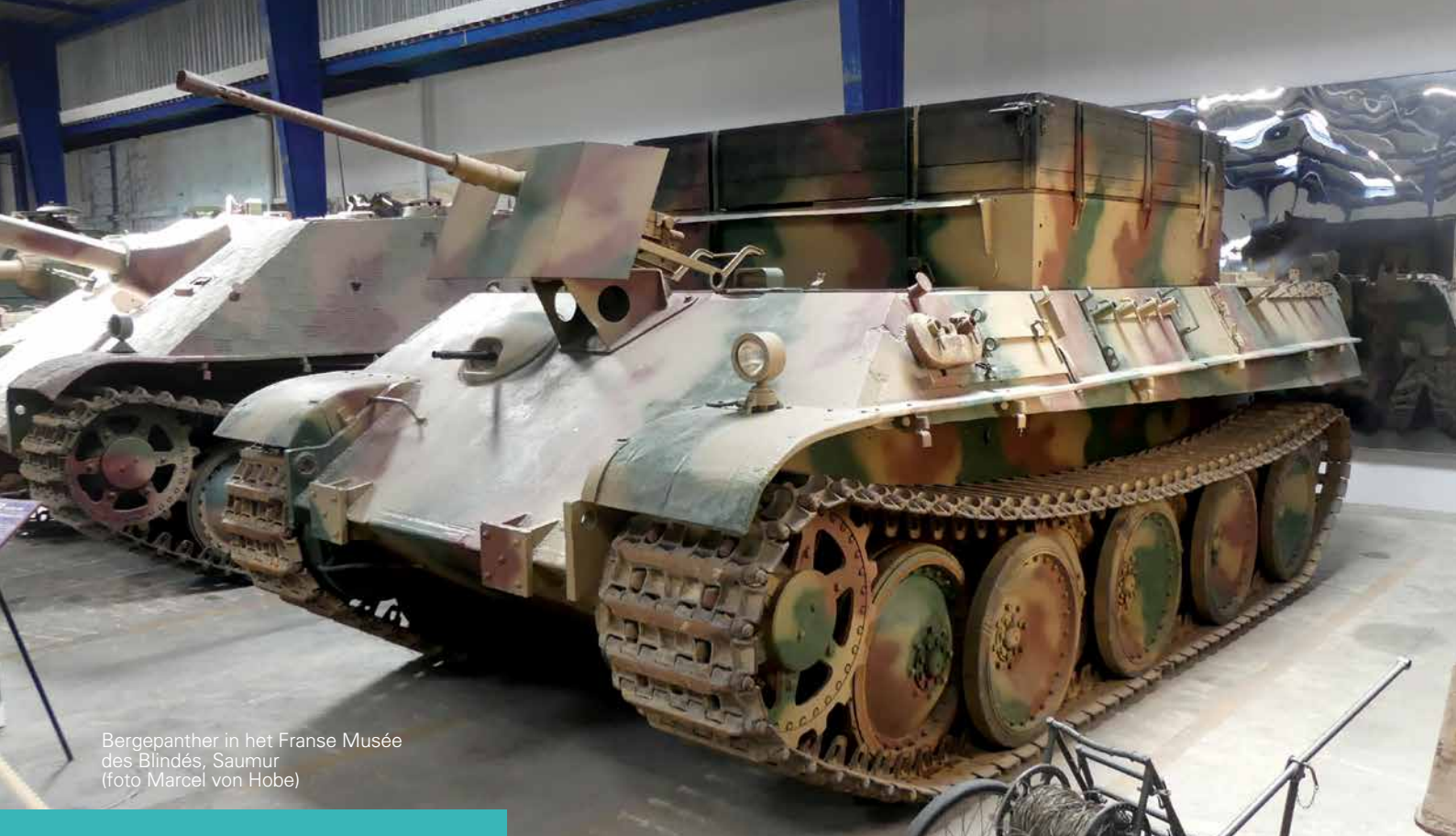
Bergepanther in het Franse Musée des Blindés, Saumur